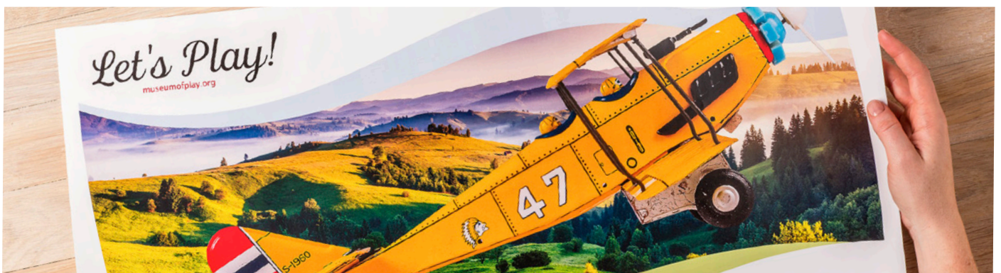
Impresión en formato largo, con un tamaño máximo de papel de 330.2 x 660 mm