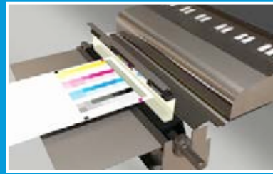
Full Width Array (FWA)

La alineación automatizada de la imagen en el material de impresión garantiza una alineación de la imagen y un registro de ambas caras perfectos independientemente del tipo de material o el tamaño de hoja, permitiéndole ahorrar tiempo y poniendo fin a los costosos residuos debidos a un registro incorrecto o al descentrado de la imagen.