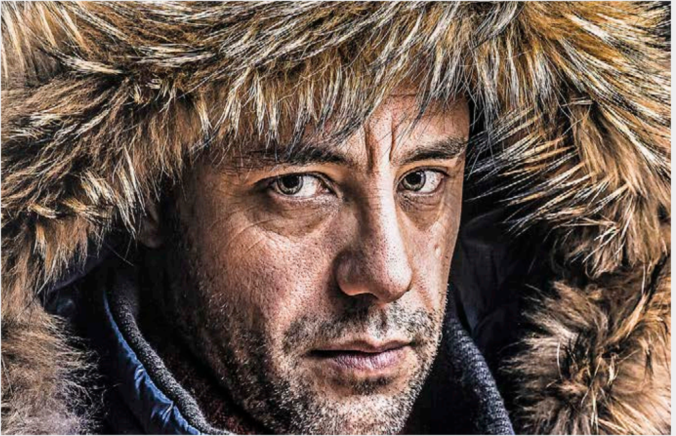
Tecnología de resolución Ultra HD